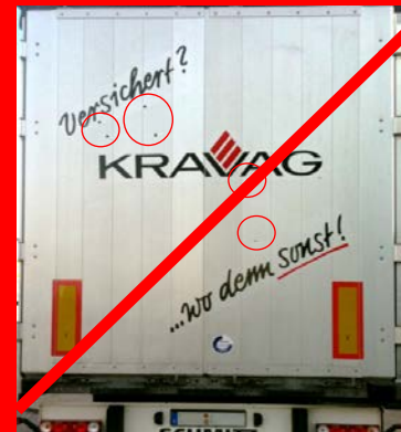
Beschriftung wurde nicht nach Passermarken* vorgenommen *(Quadrate übereinander kleben)