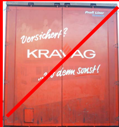
Falsche Farbe der Raute, vorgeschrieben ist hier Weiß/Outline; SVG-Werbung fehlt