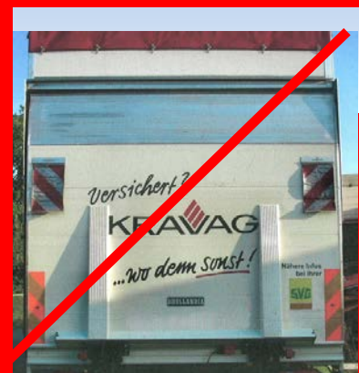
Ladebordwand mit Traversen darf nicht beschriftet werden.