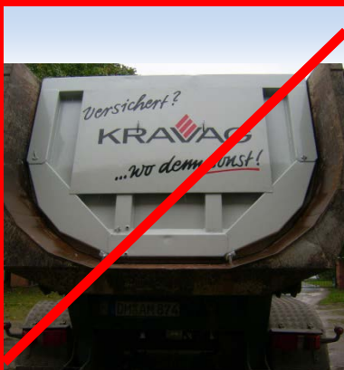
Fahrzeug zur Beschriftung nicht freigegeben. Platten dürfen nicht beschriftet werden.